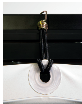
▲ Elastyczne gumki oraz oczko powierzchni projekcyjnej